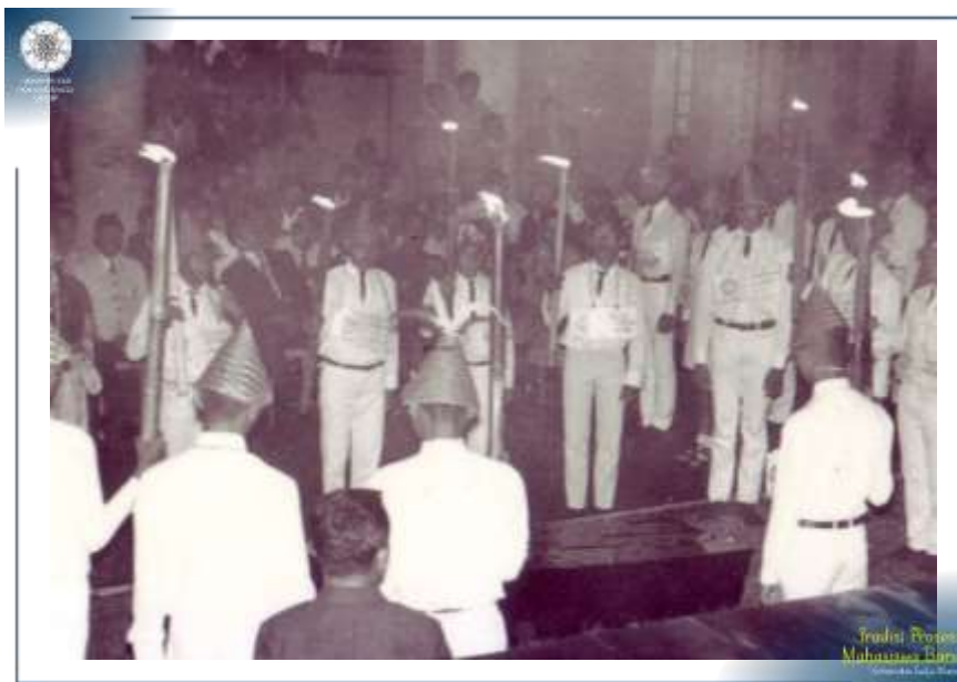
Salah satu rangkaian acara prosesi Penerimaan Mahasiswa Baru UGM Tahun 1972.