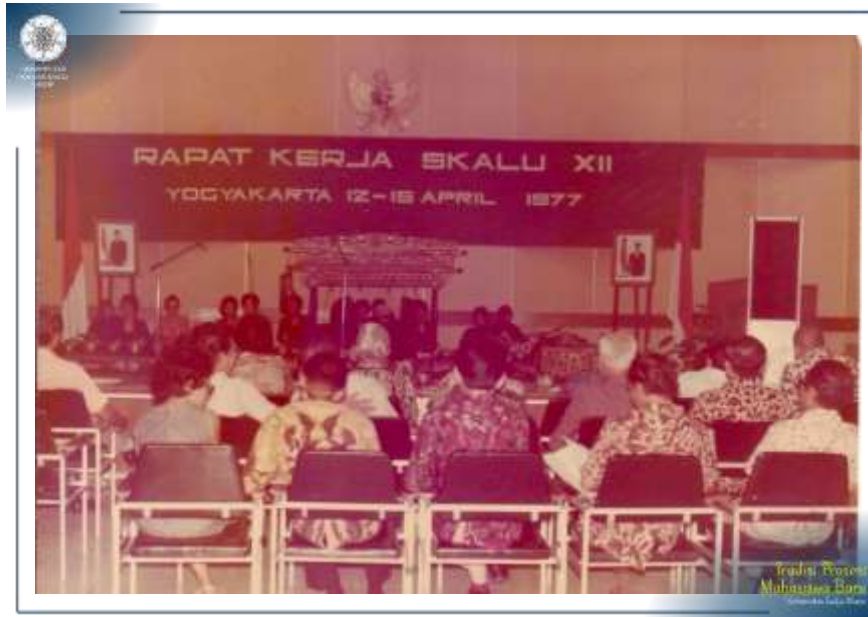
Rapat Kerja Panitia SKALU XII Tahun 1977 di Yogyakarta.

Tahun 1978, seleksi masuk UGM terjadi perubahan nama dari SKALU menjadi SIPENMARU (Seleksi dan Penerimaan Mahasiswa Baru). UGM tahun 1979 tergabung dalam Ujian Masuk Perguruan Tinggi Proyek Perintis I Pola Seleksi dan Penerimaan Mahasiswa Baru (SIPENMARU) Perintis I. Dalam Proyek Perintis 1 SIPENMARU ini ada 10 perguruan tinggi meliputi Universitas Sumatera Utara, Universitas Indonesia, Institut Pertanian Bogor, Universitas Padjajaran, Universitas Gajah Mada, Universitas Diponegoro, Universitas Airlangga, Institut Teknologi 10 Nopember, dan Universitas Brawijaya.