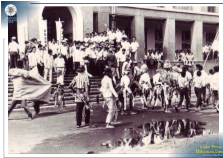
Prosesi Penerimaan Mahasiswa Baru UGM Tahun 1972 di Balairung menampilkan Pertunjukan Seni Budaya.