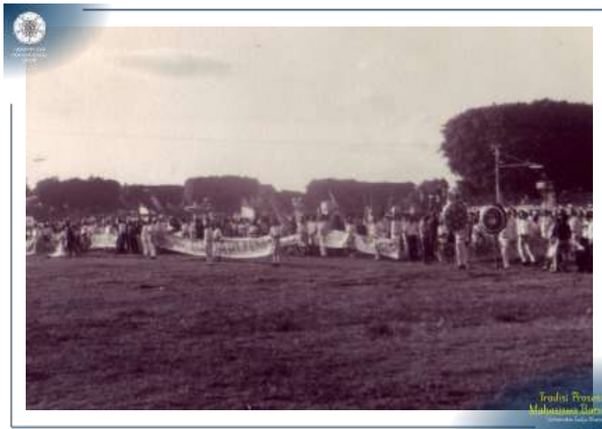
Prosesi Penerimaan Mahasiswa Baru UGM Tahun 1969 di Alun-Alun Yogyakarta.

Arsip-arsip foto khazanah Arsip UGM ini akan membawa kita melihat keseruan berbagai prosesi penerimaan mahasiswa baru pada jaman dulu.