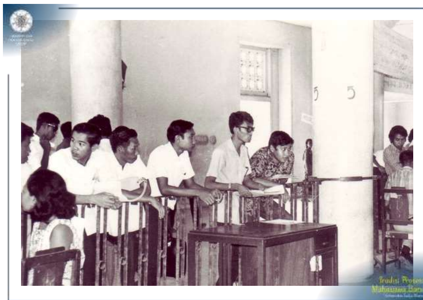
Para Calon Mahasiswa sedang antri untuk mengambil formulir pendaftaran masuk UGM Tahun 1971.

Jejak rekaman kebijakan dan kegiatan seleksi mahasiswa pada awal UGM berdiri (1949) hingga awal tahun 1970-an tidak banyak ditemukan. Seperti apa ketentuan dan nama program seleksi mahasiswa pada masa itu kurang tergambar dengan jelas. Khazanah arsip statis yang tersimpan di Arsip UGM tercatat pada tahun ajaran 1977 untuk masuk UGM calon mahasiswa harus melalui Ujian Masuk Perguruan Tinggi SKALU (Sekretariat Kerjasama antar Lima Universitas). Perguruan tinggi yang tergabung dalam SKALU ini adalah Universitas Indonesia, Institut Pertanian Bogor, Institut Teknologi Bandung, Universitas Gadjah Mada, dan Universitas Airlangga.