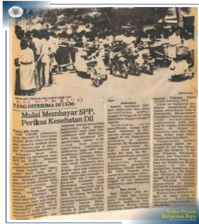
Yang Diterima Di UGM: Mulai Membayar SPP, Periksa Kesehatan, dll. (Khazanah Arsip UGM: AS/PA.KM/41.50)