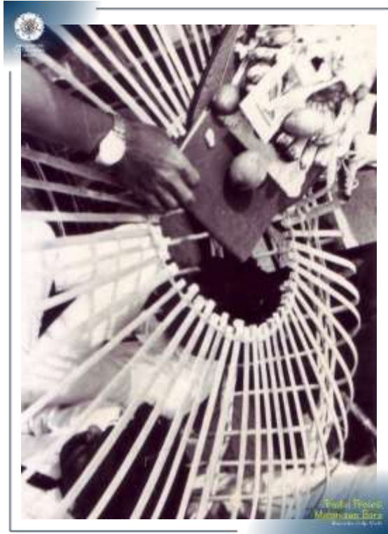
Salah satu perlengkapan tradisi prosesi Penerimaan Mahasiswa Baru UGM Tahun 1972.