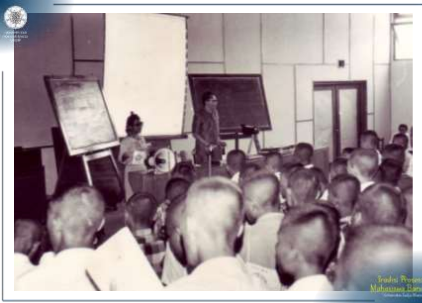
Para Mahasiswa Baru mendapatkan pengarahannya dalam prosesi Penerimaan Mahasiswa Baru UGM Tahun 1972.