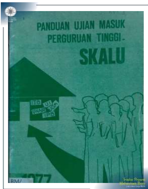
Panduan Ujian Masuk Perguruan Tinggi SKALU Tahun 1977. (Khazanah Ansip UGM: AS/RC.BM2)