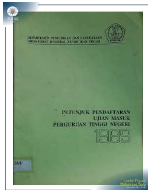
Petunjuk Pendaftaran Ujian Masuk Perguruan Tinggi Negeri (UMPTN) Tahun 1989. (Khazanah Asip UGM: AS/RC.BM/13)

Mulai tahun 1989 seleksi masuk perguruan tinggi menggunakan istilah Ujian Masuk Perguruan Tinggi Negeri (UMPTN).