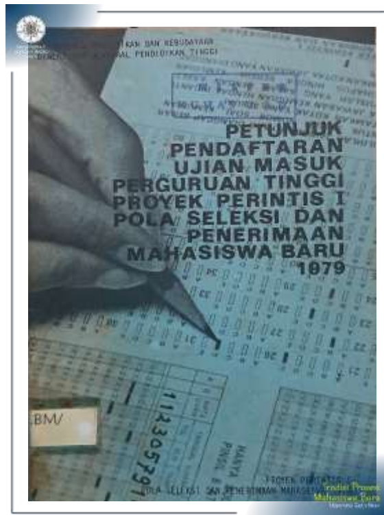
Petunjuk Pendaftaran Ujian Masuk Perguruan Tinggi Proyek Perintis I dan Pola Seleksi dan Penerimaan Mahasiswa Baru Tahun 1979. (Khazanah Arsip UGM: AS/RC.BM/3)

Sejak tahun ajaran 1984/1985 SIPENMARU dilaksanakan melalui dua jalur yaitu Penelusuran Minat dan Kemampuan (PMDK) dan Ujian Tulis.