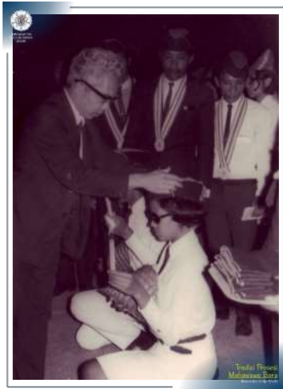
Permakalan secara simbolis atribut proses Penerimaan Mahasiswa Baru UGM Tahun 1971.