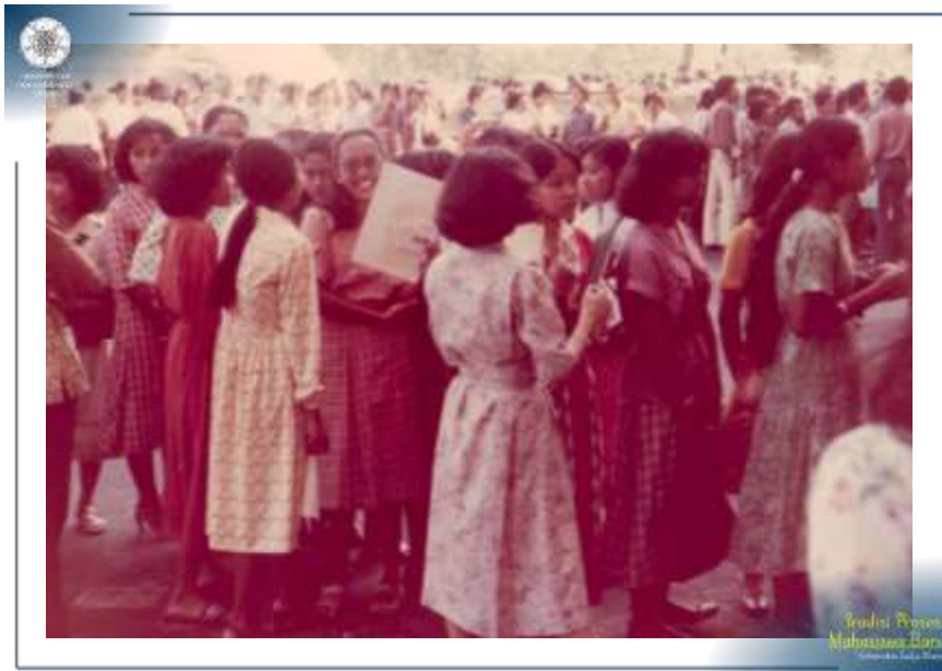
Para Calon Mahasiswa antri mendaftar ujian masuk UGM pada Tahun 1979. (Khazanah Arsip UGM: AF2/AM.MM/1979-3B)