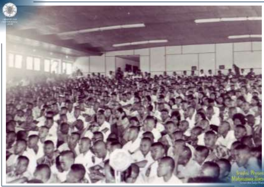
Para Mahasiswa Baru UGM mengikuti kegiatan prosesi Penerimaan Mahasiswa Baru pada Tahun 1972.