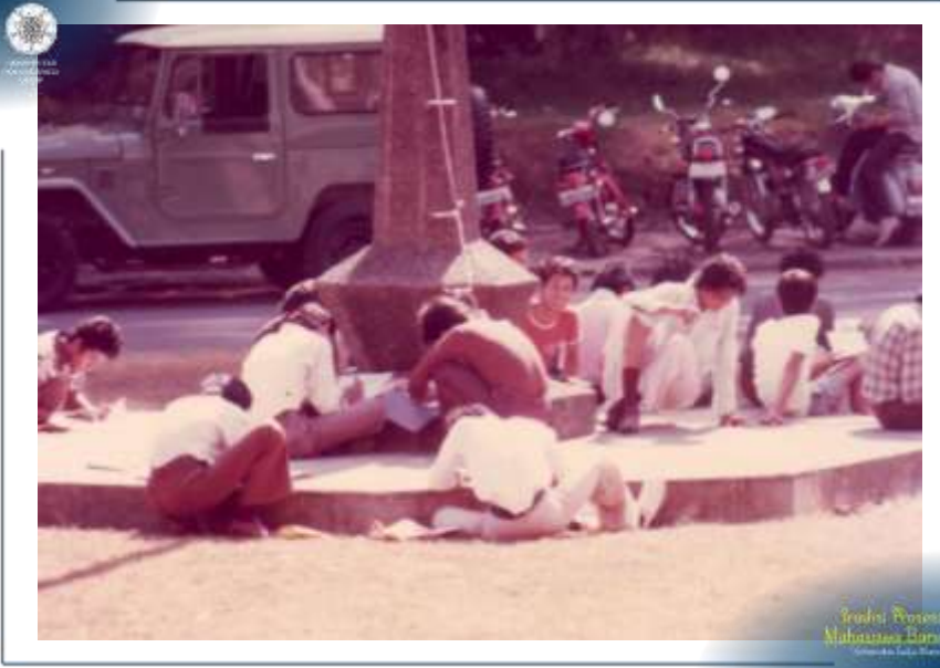
Studi Pustaka Mahasiswa Baru Universitas Gajah Mada