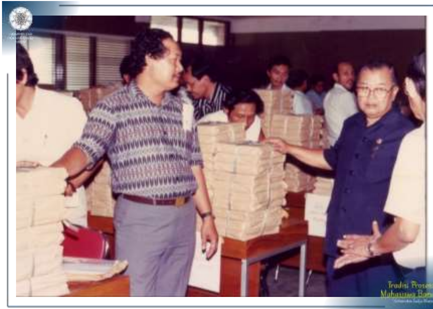
Rektor UGM memantau proses distribusi soal ujian masuk Perguruan Tinggi di UGM Tahun 1988.