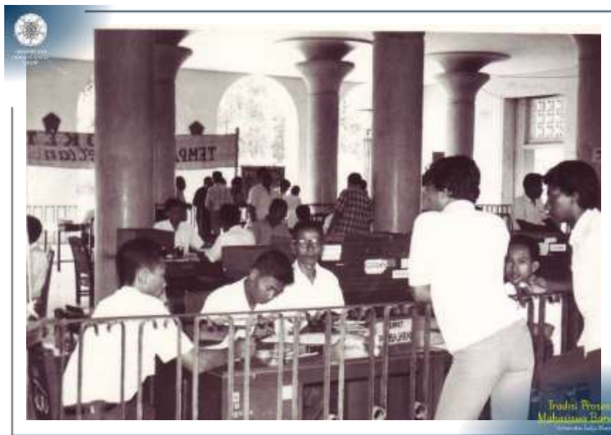
Sekretariat pendaftaran ujian masuk UGM Tahun 1971 di Balairung. (Khazanah Arsip UGM: AF/AM.MM/1971-3C)