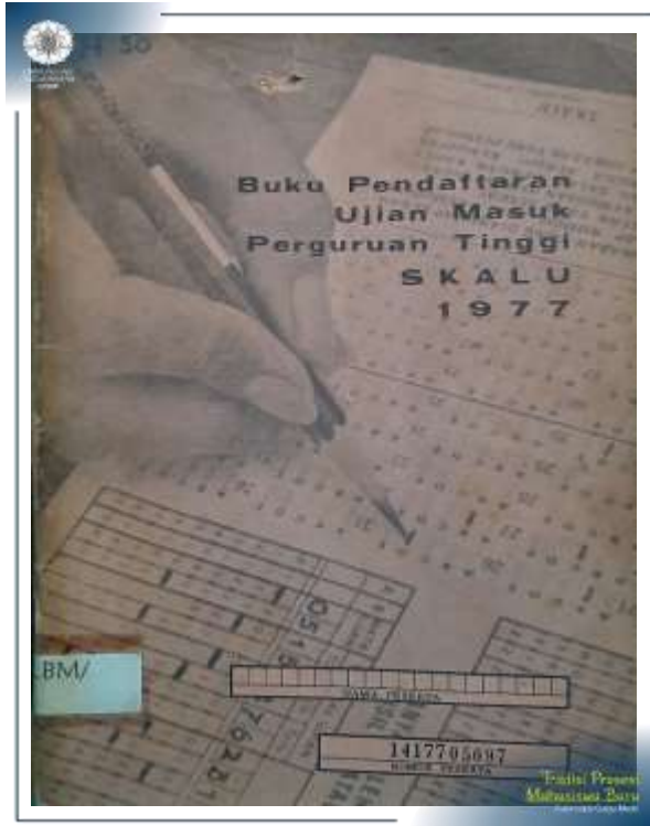
Buku Pendaftaran Ujian Masuk Perguruan Tinggi SKALU Tahun 1977. (Khazanah Ansip UGM: AS/RC.BM*)