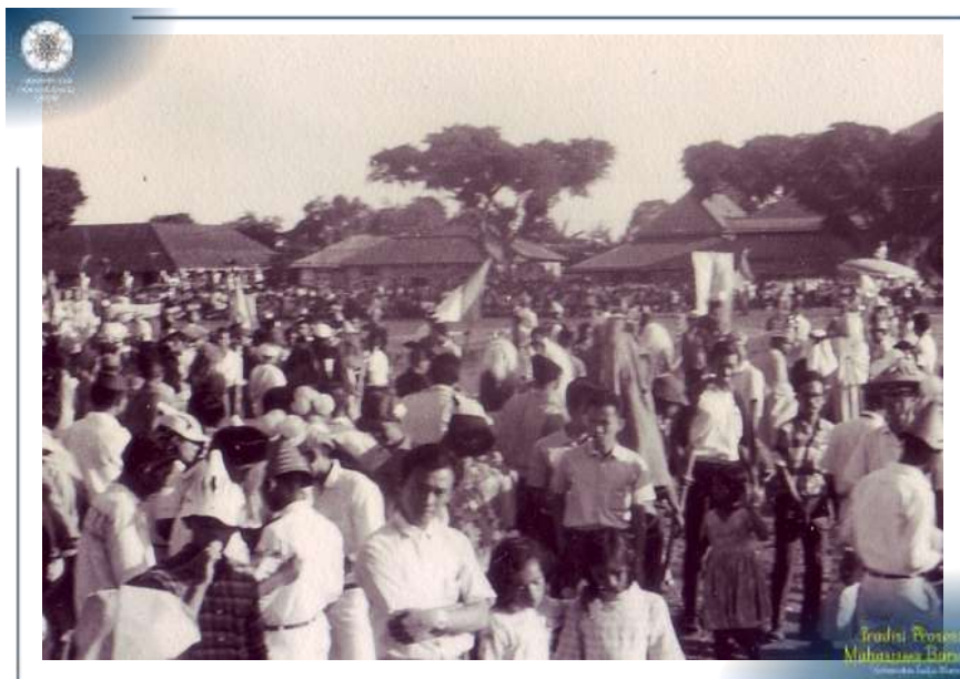
Para Mahasiswa Baru UGM mengikuti prosesi Penerimaan Mahasiswa Baru Tahun 1969. (Khazanah Arsip UGM: AF/AM.MM/1969-1H)