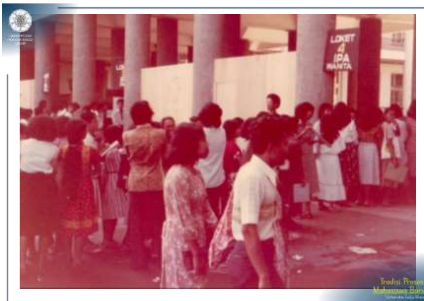
Antrian di loket pendaftaran ujian masuk UGM Tahun 1979.