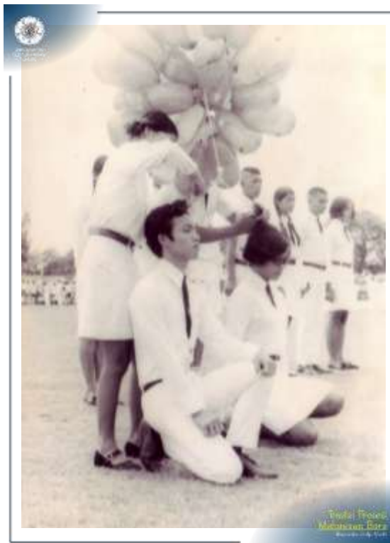
Upacara pembukaan prosesi Penerimaan Mahasiswa Baru UGM Tahun 1971.