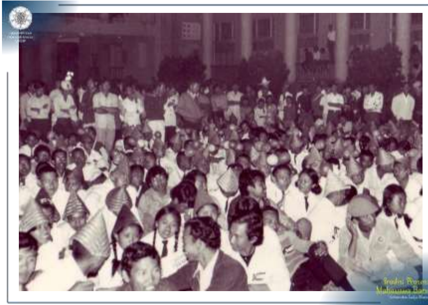
Prosesi Penerimaan Mahasiswa Baru UGM Tahun 1972 di halaman Balairung.