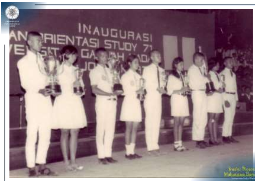
Inaugurasi Pekan Orientasi Study UGM Tahun 1971.