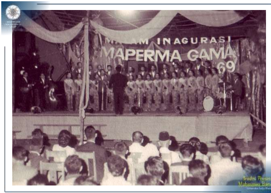
Malam Inagurasi sebagai rangkaian prosesi MAPERMA Tahun 1969.