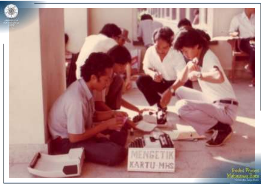
Bagi peserta ujian yang lolos, mereka antri dalam pembuatan Kartu Mahasiswa Tahun 1983.