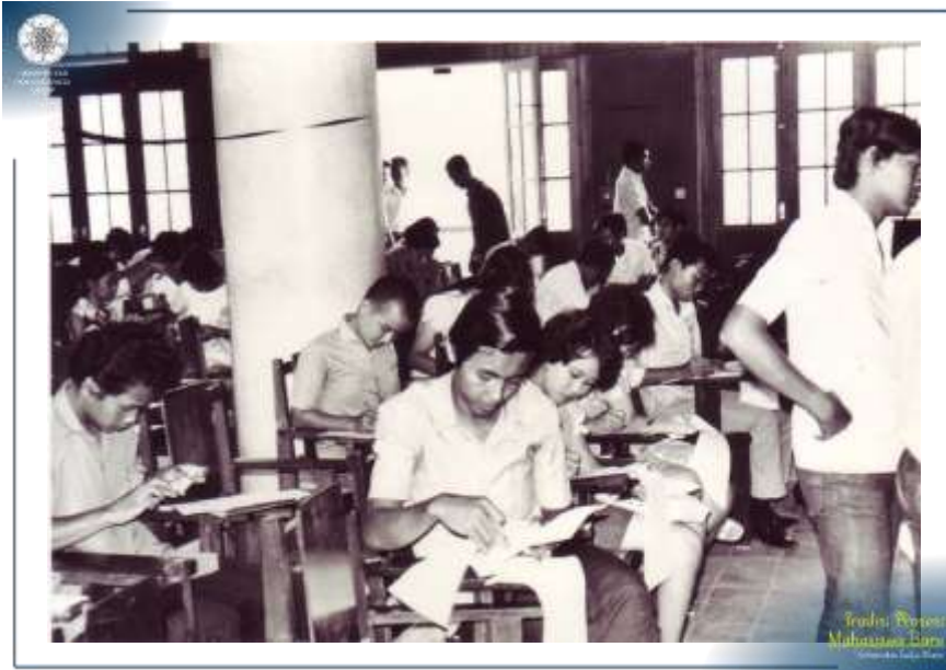
Para Calon Mahasiswa sedang mengisi formulir pendaftaran ujian masuk UGM Tahun 1971.